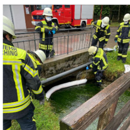
Ölwehr Hachinger Bach