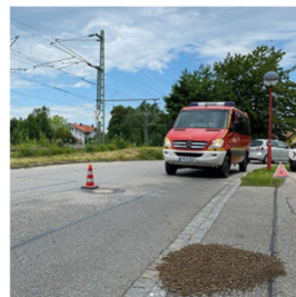
Bienen auf Fahrbahn